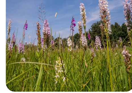
Wiese mit Geflecktem Knabenkraut und Wiesen-Gladiole

Verschollene Wiesenpflanzen: Sumpf-Siegwurz, Kleines Knabenkraut, Fleischrotes Knabenkraut, Sumpf-Herzblatt, Sumpf-Läusekraut