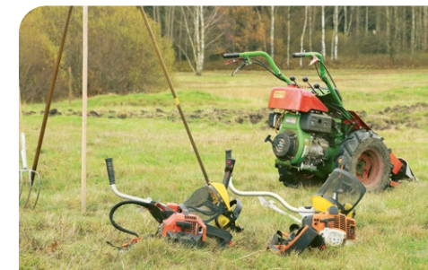
Technik zur Pflege der Gladiolenwiese

Damit beschäftigen sich Forschungsprojekte. Auch Versuche zur Umsetzung und Wiederansiedlung der Arten an geeigneten Standorten laufen aktuell. Bei der Wiesen-Gladiole klappt das am besten durch das Auspflanzen von vorher vermehrten Zwiebeln. Bei Orchideen werden Pflanzungen und Aussaaten erprobt.