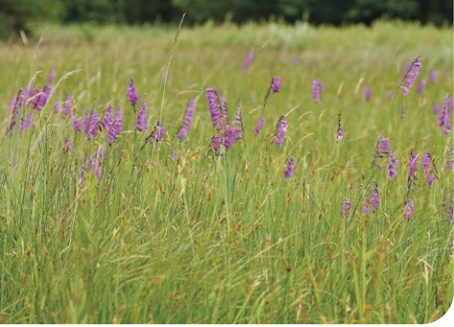
Die Gladiolenwiese im Daubaner Wald – Naturwunder 2017