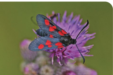
Sumpfhornklee-Widderchen auf Sumpf-Kratzdistel

Das größte deutsche Vorkommen der Wiesen-Gladiole liegt im Biosphärenreservat auf der DBU-Naturerfläche „Daubaner Wald“. Diese Gladiolenwiese wurde in einem deutschlandweiten Wettbewerb der Heinz-Sielmann-Stiftung und des Europarc Deutschland e.V. als Naturwunder 2017 zur schönsten Wiese Deutschlands gewählt.